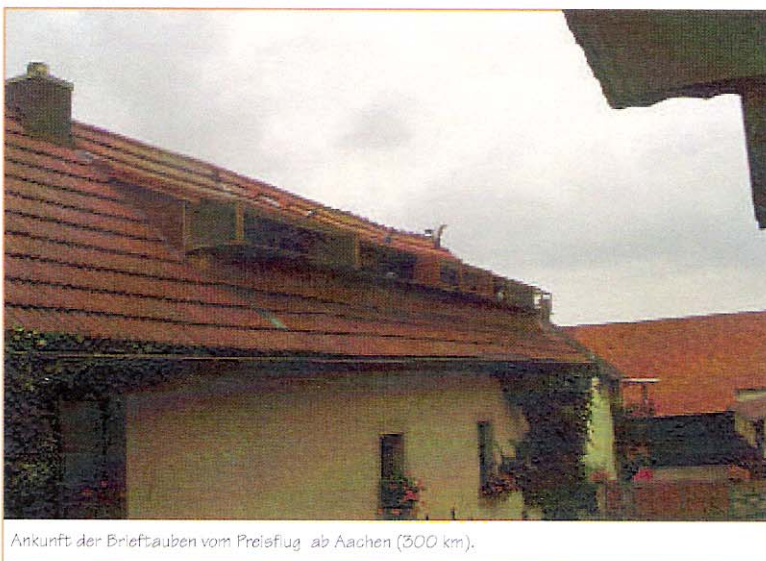
Ankunft der Brieftauben vom Preisflug ab Aachen (300 km).

Im Dachbereich des Nebengebäudes befinden sich die Taubenschläge, welche man von der am Wohnhaus hochgelegenen Terrasse sehr praktisch erreichen und die Tauben sehr gut beobachten kann. Bei einem Rundgang durch die verschiedenen Abteile sah unsere Jugendgruppe einen sehr gut durchdachten und funktionellen Schlag. Die von den Jugendlichen gestellten Fragen zum Thema Fütterungssystem, Vorbereitung auf den Preisflug, die Merkmale einer guten